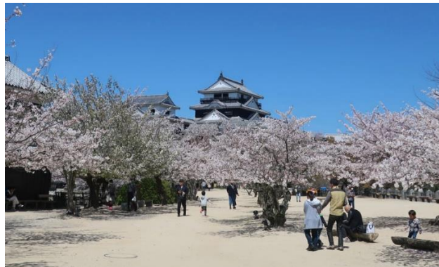
Lâu đài Matsuyama

Trường chúng tôi tọa lạc tại thành phố Matsuyama tỉnh Ehime, là nơi có thể cảm nhận văn hóa, ẩm thực, thiên nhiên tuyệt vời của Nhật Bản. Matsuyama là thành phố được bao quanh bởi biển và núi, có khí hậu ôn hòa, có vùng biển Setonaikai nơi đánh bắt được các loại cá tươi ngon. Ngoài ra, nằm giữa thành phố là tòa lâu đài Matsuyama và nhiều di tích lịch sử cổ kính, còn có cả suối nước nóng Dogo Onsen được cho là suối nước nóng lâu đời nhất Nhật bản, một thành phố đầy ắp những tấm lòng hiếu khách nồng hậu của người dân.