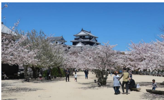
Lâu đài Matsuyama

Trường chúng tôi tọa lạc tại thành phố Matsuyama tỉnh Ehime, là nơi có thể cảm nhận văn hóa, ẩm thực, thiên nhiên tuyệt vời của Nhật Bản. Matsuyama là thành phố được bao quanh bởi biển và núi, có khí hậu ôn hòa, có vùng biển Setonaikai nơi đánh bắt được các loại cá tươi ngon. Ngoài ra, nằm giữa thành phố là tòa lâu đài Matsuyama và nhiều di tích lịch sử cổ kính, còn có cả suối nước nóng Dogo Onsen được cho là suối nước nóng lâu đời nhất Nhật bản, một thành phố đầy ắp những tấm lòng hiếu khách nồng hậu của người dân.