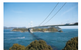
しまなみ海道 島並海道